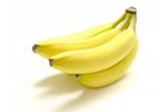
des bananes jaunes