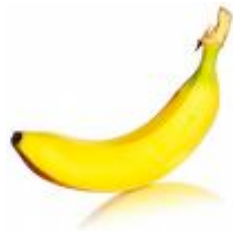
une banane jaune

Il accompagne un nom avec lequel il s'accorde en genre et en nombre :